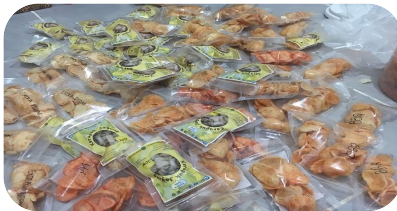
Gambar 2. Hasil Output Dari Buah Jagung

Adapun hasil dari produk yang kami hasilkan yaitu Kerupuk Jagung Beraneka Rasa (Keja Beras) sebagai inovasi olahan jagung.