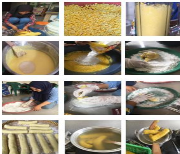
Gambar 1. Proses Pembuatan KejaBeras (Krupuk Jagung Beraneka Rasa)