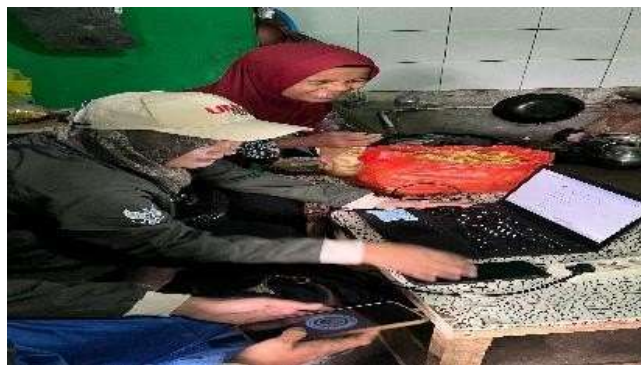
Gambar 3 Pendampingan akuntansi sederhana

Selain aspek legalitas, kegiatan ini juga fokus pada peningkatan kapasitas akuntansi dasar melalui pelatihan pencatatan keuangan sederhana. Peserta diajarkan cara mencatat pemasukan, pengeluaran, serta menyusun laporan laba rugi menggunakan buku kas sederhana. Beberapa peserta bahkan mulai memanfaatkan aplikasi kas digital setelah memahami manfaatnya dalam memonitor keuangan harian.