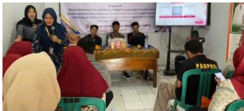
Gambar 1 Sosialisasi prosedural

Temuan kegiatan menunjukkan bahwa fasilitasi Online Single Submission (OSS) melalui bimbingan teknis langsung memudahkan pelaku UMKM dalam mengurus NIB. Sebelumnya, mereka merasa kesulitan karena keterbatasan akses internet dan kurangnya pemahaman teknis. Setelah diberikan modul prosedural yang disusun secara sederhana dan aplikatif, para pelaku usaha mampu mengikuti tahapan pendaftaran secara mandiri. Hasil ini menguatkan pentingnya fasilitasi OSS dalam meningkatkan efektivitas penerbitan NIB bagi UMKM, sebagaimana diungkapkan oleh Putri dan Santoso (2021), bahwa OSS berbasis risiko mampu memangkas birokrasi perizinan dan memberikan kepastian hukum yang lebih cepat. Namun, hambatan utama masih terletak pada rendahnya literasi digital, terutama di wilayah pedesaan. Oleh karena itu, keberadaan modul prosedural dan pendampingan langsung menjadi faktor penting dalam mempercepat proses legalisasi usaha.